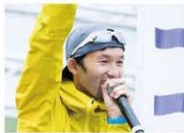
プロスカイランナー 松本 大

桐生市出身。日本のトレイルランニングの第一人者。国内主要レースでの優勝後、海外レースに進出。ウルトラトレイルの世界最高峰大会UTMBで日本人初の3位の他世界レベルで活躍。レースの傍、大会プロデュースや講演会、講習会等のトレイルランニングの普及にも力を注ぐ。